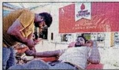
पंचकूला के सेक्टर-6 मार्केट में लगाए शिविर में रक्तदान करते लोग।