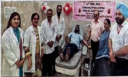
सैक्टर-16 स्थित जी.एम.एस.एच. में आयोजित किए गए रक्तदान शिविर के दौरान हैल्थ निदेशक और अन्य सौनियर स्टाफ मौजूद रहा।