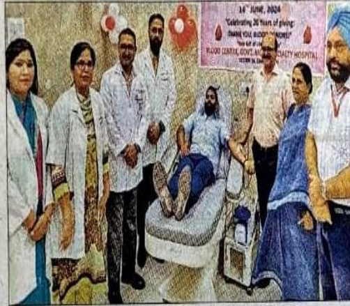
जीएमएसएच 16 के ब्लड बैंक में रक्तदान करते लोग।

चंडीगढ़। विश्व रक्तदाता दिवस के अवसर पर शुक्रवार को शहर में कई जगह शिविर लगाए गए। इन शिविरों में 882 लोगों ने रक्तदान किया। पीजीआई में रक्तदान शिविर लगाया। वहीं, संस्थान की टीम की देखरेख में ट्राइसिटी में दो अन्य शिविर भी लगाए गए। तीनों शिविरों में 350 युवाओं ने रक्तदान किया। इस वर्ष की थीम दान के 20 साल पूरे, रक्तदाताओं को धन्यवाद रखी गई थी। विश्वास फाउंडेशन ने लगाया शिविर, 70 ने किया रक्तदान : इसी क्रम में विश्वास फाउंडेशन की ओर से मार्केट सेक्टर-11डो चंडीगढ़ में शिविर लगाया गया। इसमें ब्लड बैंक कमांड अस्पताल चंडीगढ़ की टीम ने 70 यूनिट रक्त एकत्रित किया। व्यूरो