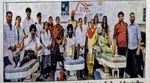
सेक्टर-37 स्थित रोटरी एंड ब्लड बैंक सोसाइटी रिसोर्स सेंटर पर सीएटीएस ने कैन एंड विल फाउंडेशन के सहयोग से शिविर लगाया। इसमें 151 लोगों ने रक्तदान किया। अमर उजाला