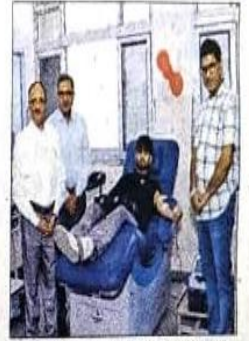
जीएमसीएच-32 में आयोजित शिविर में रक्तदान करता युवक।