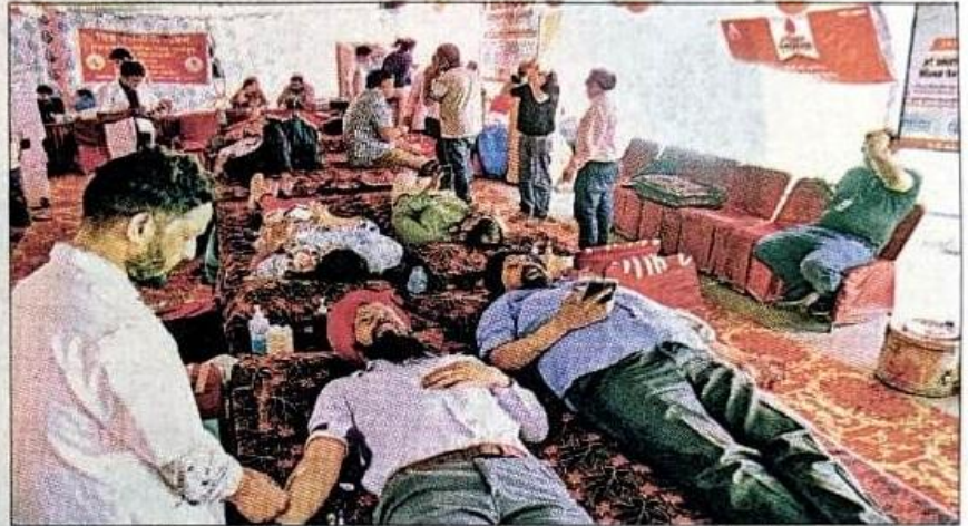
सेक्टर-17 स्थित ब्रिज मार्केट में आयोजित शिविर में रक्तदान करते लोग।

उधर, पंचकूला के सेक्टर-6 मार्केट में विश्वास फाउंडेशन, सिटी मेडिकोस व