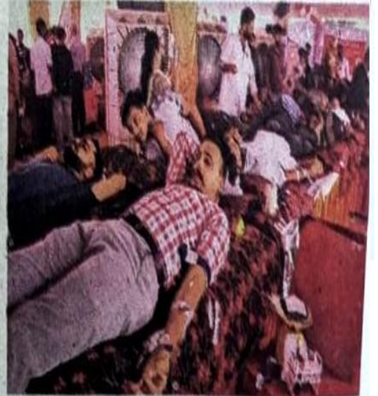
चंडीगढ़ : सेक्टर-17 में लगाए गए शिविर में रक्तदान करते लोग