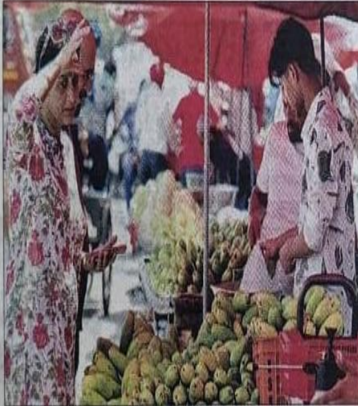
सेक्टर-26 स्थित सखी मंडी में आम बेचते हुए दुकानदार।