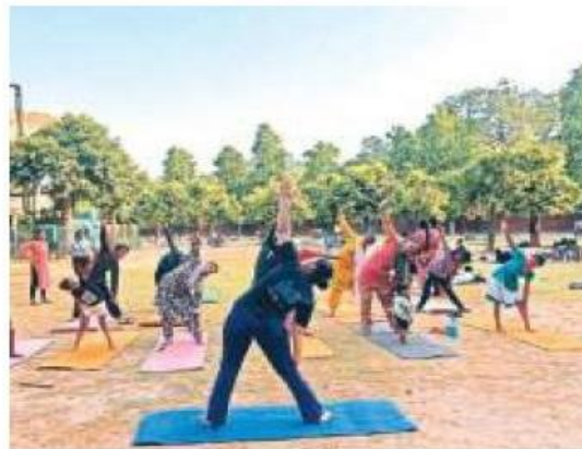
The event is being organised by 'CCRYN - Collaborative Centre for Mind-Body Intervention through Yoga'

EXPRESS NEWS SERVICE CHANDIGARH, JUNE 19