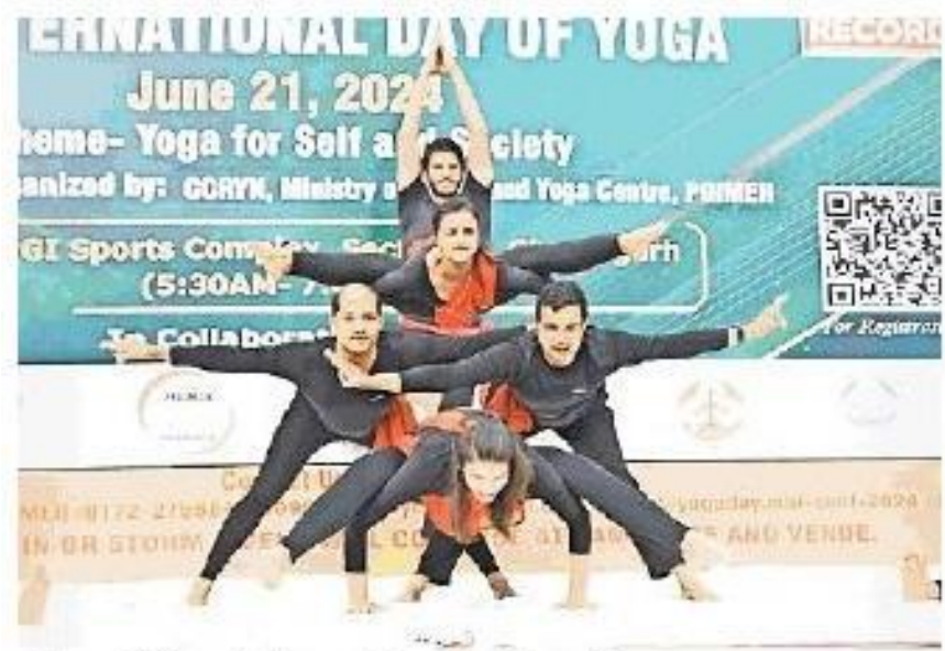
चंडीगढ़ : पीजीआइ में योग करवाते विद्यार्थी • डीपीआर पीजीआइ