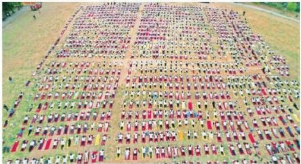
Healthcare professionals perform yoga at PGIMER's Collaborative Centre for Mind Body Intervention on Friday.

"According to a study, 68 per cent of people in urban areas are physically inactive and have hypernutrition and stress, which are the major causes of non-communicable diseases (NCDs). Yoga is not just exercise, it's a deep science