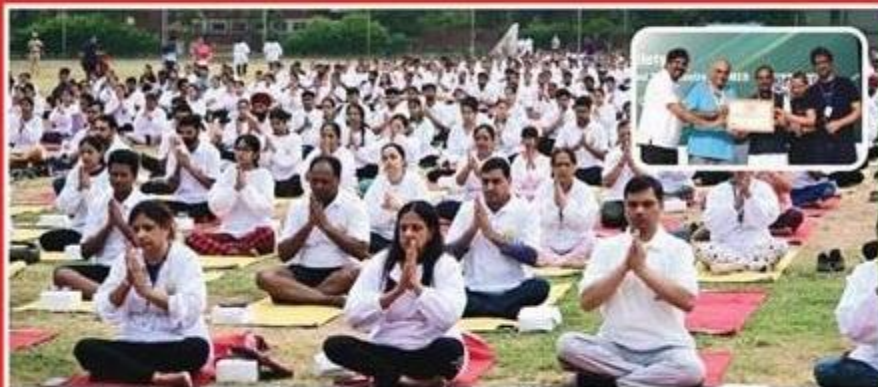
चंडीगढ़ पीजीआई में योग करने का एशिया बुक ऑफ रिकॉर्ड दर्ज किया गया है। यल करीब 1924 स्वस्थ कर्मियों ने एक ही जगह पर योग किया है।