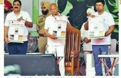
अंतरराष्ट्रीय योग दिवस पर शुक्रवार को रॉक गार्डन में कैनेडर जारी करते पंजाब के राज्यपाल व चंडीगढ़ के प्रशासक मनजरीलाल पुरोहित।

एक साथ मिली कई सौगात इस अवसर पर छात्र कल्पना मॉड्यूल लॉन्ग किंग, विश्व में पहला 5 मिनट के योग मॉड्यूल के आधार पर अलग-अलग मन विधियों पर कवु किताब या सकता है। इसके साथ ही योग केंद्र ने एनेस्थेसियोलॉजी विभाग के साथ योग से बुद्धिमत्ता के विषयों में दर्द के लिए योग पर एक पुस्तिका लॉन्ग की, जो योगियों को घर पर अभ्यास करने के लिए दी जाएगी। महान में योग केंद्र के नए विंग का उद्घाटन किया गया। संस्थान में सुबह 11 बजे निर्वाचित 5-मिनट-बैंक प्रोटोकॉल जारी रखने के लिए 35 वेडल स्वीटनेस को प्रोत्साहित किया गया।